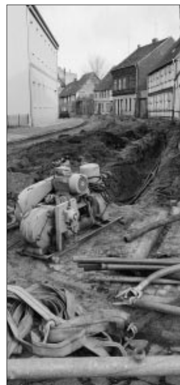
Die Steinstraße im Dezember 1998

Ihre Fortsetzung und ihren vorläufigen Abschluß werden die Straßenbaumaßnahmen für die Altstadt später in der Burgstraße vom Elbtor bis zum Kirchplatz und dann auf dem Stück vom Kirchplatz bis zum Steintor finden.