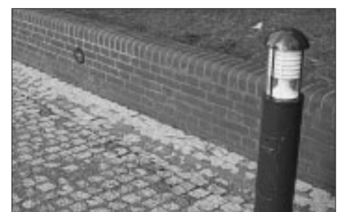
Erinnerung an die Pferdemarktzeit: Anbinde-Ringe in der Kirchplatzmauer

Die Bauarbeiten – von den Wittenbergern gespannt verfolgt – begannen im Sommer 1997 nachdem Bauminister Hartmut Meyer zur Einweihung der renovierten Steinstraße die Finanzierungszusage für die Fertigstellung des Kirchplatzes mitgebracht hatte. An der Südseite der Kirche ging es dann 1998 zur Sache, und abgeschlossen wurden die Arbeiten gerade rechtzeitig zum Stadtfest im August. Als Festort hat der Kirchplatz seine Bewährungsprobe noch im Herbst bestanden. Ob er sich auch als Wohnort etablieren kann, werden die Bauanträge der nächsten Jahre erweisen. ALTSTADTNEU wird berichten. ●