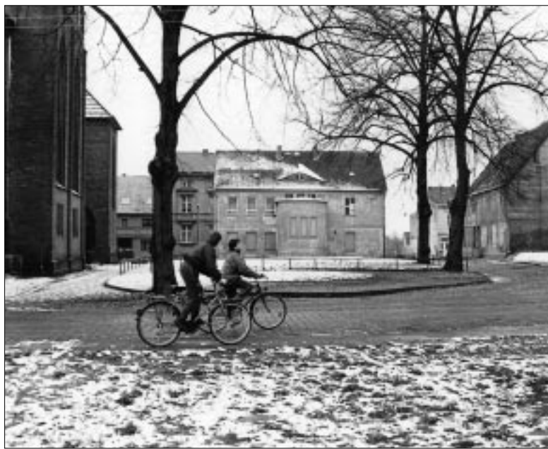
... 1992 ...