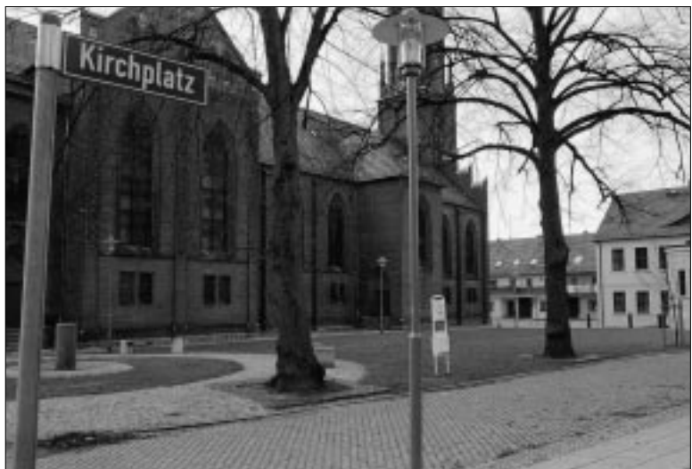
... und heute