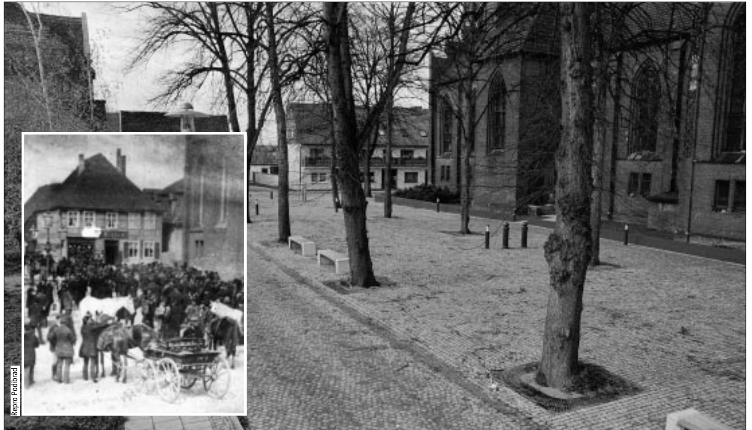
Der Kirchplatz: um 1900 und heute

Lange Zeit dämmerte der Ort, von dem die Entwicklung der Stadt Wittenberge einst ihren Ausgang nahm, zerzaust vor sich hin. Im letzten Jahr aber ist das Areal um die Kirche unmißverständlich wieder zum Leben erwacht: Mit der Neugestaltung der öffentlichen Flächen besteht die Möglichkeit, den Kirchplatz zu einem kulturellen Zentrum der Stadt zu machen. Und diese Möglichkeit wurde im vergangenen Herbst bereits heftig genutzt.