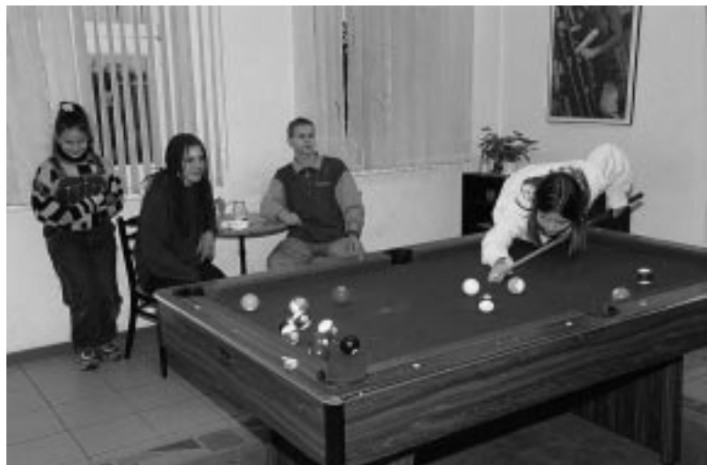
Wittenberger Jugendliche finden am Kirchplatz Raum für Freizeitaktivitäten – drinnen ...

„Es gab früher jede Menge Kinder hier“, erinnert sich ein inzwischen ergrauter Wittenberger an die Zeit, als die Altstadt noch Wohnort für etliche hundert Familien war, „und am Kirchplatz trafen wir uns mit Fußball und Fahrrad.“