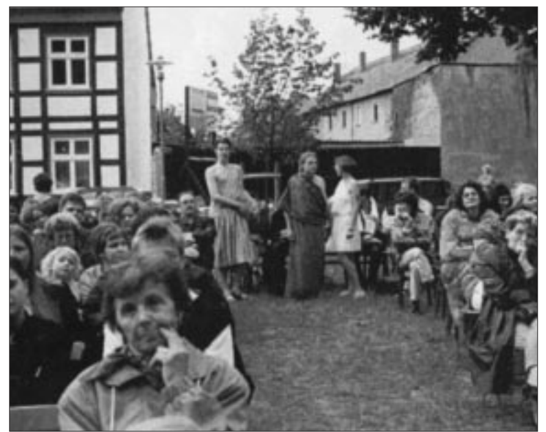
Macht Lust auf mehr: die gelungene Freiluft-Theateraufführung vom Juli 1998

Obwohl anfangs noch im Bau, wurde der Kirchplatz im letzten Sommer schon voll genutzt: Juli-August-September – mit den Veranstaltungsterminen ging es Schlag auf Schlag, so daß man fragen konnte, wie das kulturelle Leben Wittenberges vorher ohne das Zentrum der Altstadt ausgekommen ist.