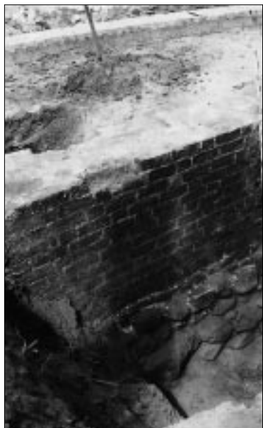
... unter dem das Fundament der Wittenberger ‚Ur-Kirche‘ verborgen liegt.