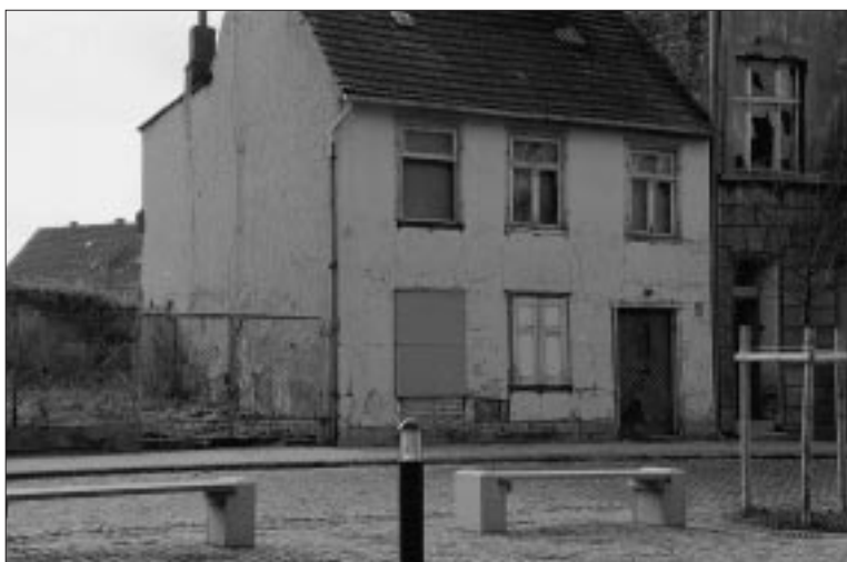
Kirchplatz 12–13 heute (oben) und hoffentlich demnächst (unten)