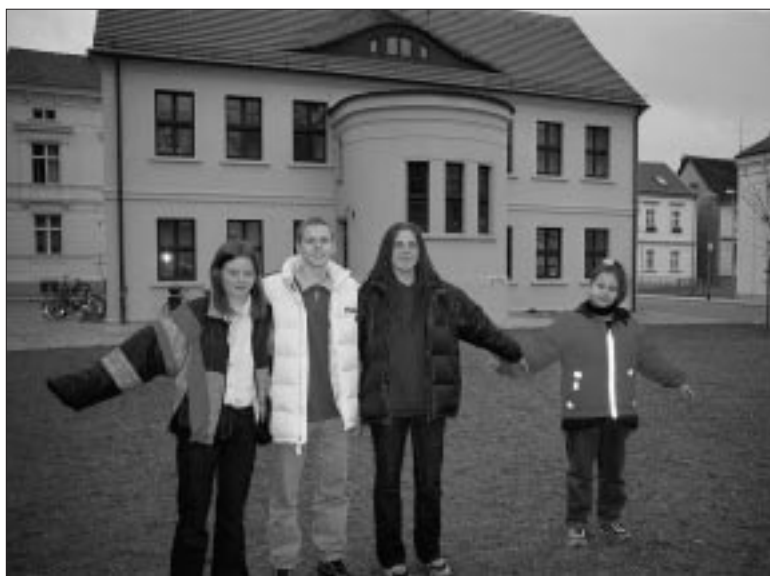
... und draußen

Aber nicht nur Stubenhocker-Aktivitäten wünschen sich die Gäste der Kochschule. Der robuste Schotterrasen der nördlichen Kirchplatzhälfte eignet sich in ihren Augen gut für Sport und Spiel an frischer Luft. „Wir möchten die Rasenfläche gerne für Volleyball-Matches nutzen“, fordern sie und verschweigen nicht, daß sie damit in der Vergangenheit bereits mit Anwohnern zusammengerauselt sind. Bisher – so auch der Eindruck von ALTSTADTNEU – ist der Kirchplatz tatsächlich eher eine Sache für die Erwachsenen. Das wird sich aber sicher ändern, wenn in Neubauten auf Grundstücken rundum Familien mit Kindern eingezogen sein werden. ●