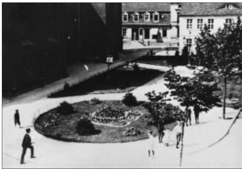
Der Kirchplatz: einst, ...